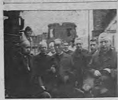
La gráfica recoge un instante episcopal del arzobispo, a esta capital, del señor arzobispo de Costa Rica, doctor Castro y Jiménez, en la tarde de ayer, cuando, rodeado de las autoridades eclesíasticas y civiles, inició el viaje a la iglesia catedral, donde, por su feliz regreso se cantó un solemne te deum.